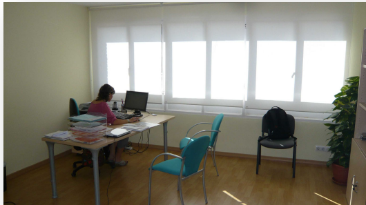
Secretaría en la sede del COLCV en la calle Gascó Oliag de Valencia. 11 de junio de 2010

personas y una sala donde se pueden impartir cursos de formación de hasta treinta personas. Esperamos que los nuevos locales permitan incrementar notablemente la participación en la gestión del colegio, a través de las Comisiones, y también la "vida colegial", a través de los grupos de trabajo y del programa de formación.